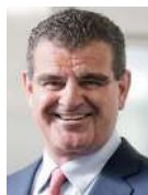
Peter Spuhler anc. conseiller national UDC Chef d'entreprise

« Un congé de paternité imposé par la loi n'est pas supportable financièrement face à la crise économique provoquée par la pandémie Covid-19 et face à l'explosion des charges sociales. »